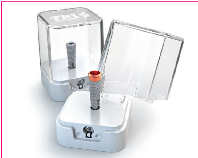
Tri Pod. Handling neu durchdacht.

Das berührungslose Packaging Konzept von TRI Pod kombiniert Einfachheit mit innovativem Design. Dieses revolutionäre Konzept ermöglicht das Implantat mit dem Instrument direkt und in einem einzigen Schritt zu lösen, um dadurch die höchste Reinheit der TRI SBA Oberfläche zu garantieren und den Behandlungsablauf maximal zu vereinfachen. Die Implantation kann auf drei Arten erfolgen: mit der Ratsche, mit dem chirurgischen Handstück oder von Hand.